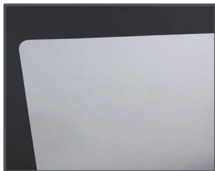
Finitions en arrondi de grande qualité