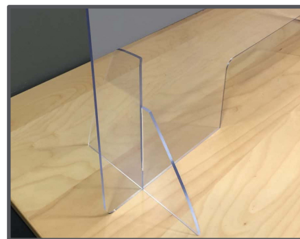
Supports de fixation