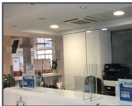
Passe-documents de 15 cm x 30 cm